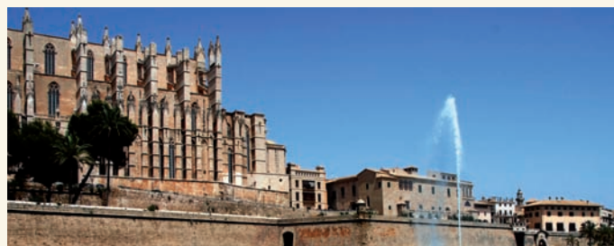
Palma de Majorque, Iles Baléares