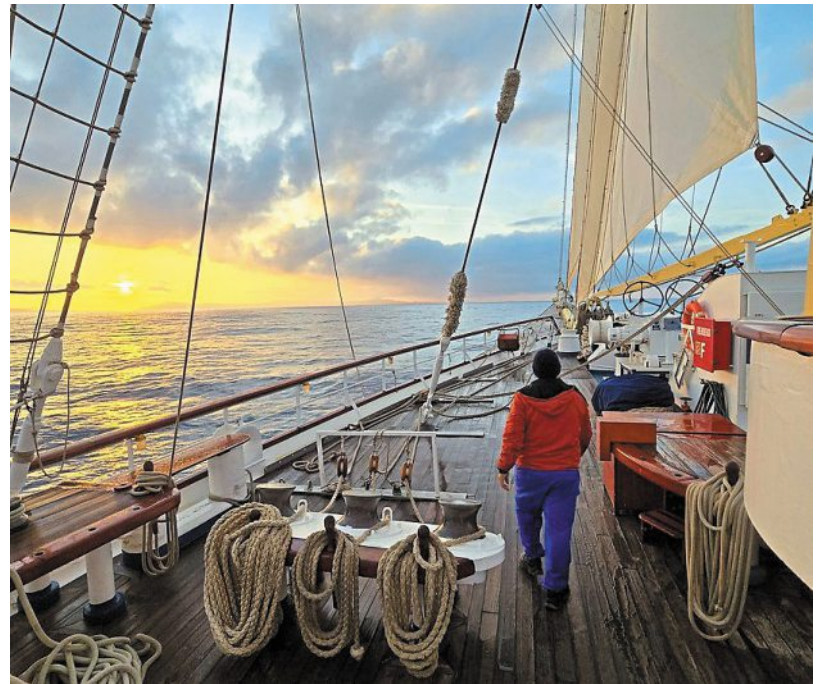
Un matelot, sur le pont du voilier « Star Flyer », de Star Clippers.

À l'aube du septième jour, l'île d'Elbe (Italie) apparaît. Le ciel s'embrase, les voiles se gonflent, la bannière italienne claqué au vent. On débarque à Porto Cervo, sur les traces de Napoléon. Sa maison d'exil, les trompe-l'œil et le mobilier néoclassique