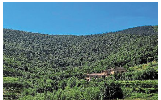
Le voilier « Star Flyer » de Star Clippers sur la Méditerranée ; escale à Bonifacio, en Corse ; l'île d'Elbe, archipel toscan où Napoléon a été exilé.